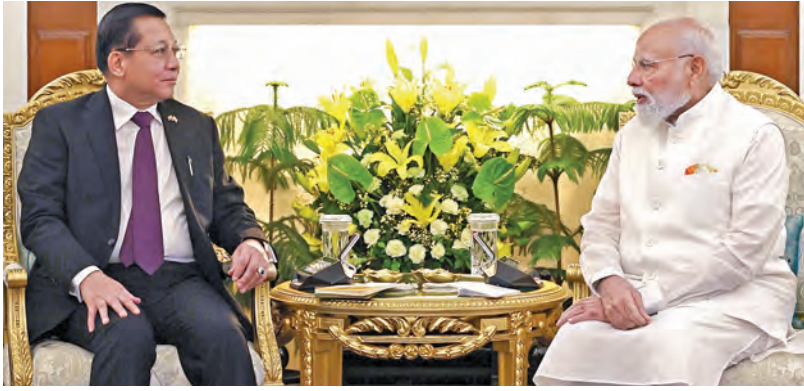
సోమవారం న్యూఢిల్లీలో ప్రధాని మోడీతో భేటీ అయిన మయన్మార్ అధ్యక్షుడు యూ మిన్ ఆంగ్