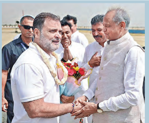
రాజస్థాన్ లోని కిషన్ గర్డ్ విమానాశ్రయంలో రాహుల్ గాంధీకి స్వాగతం పలుకుతున్న పార్టీ సీనియర్ నాయకుడు అశోక్ గెహ్లాట్