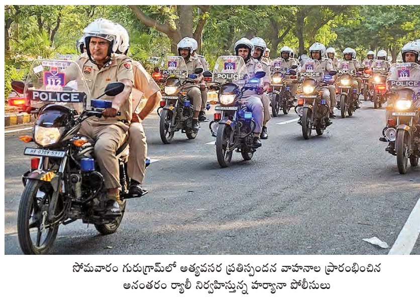
సోమవారం గురుగ్రామ్ లో అత్యవసర ప్రతిస్పందన వాహనాల ప్రారంభించిన అనంతరం రాత్రి నిర్వహిస్తున్న హార్వానా పోలీసులు