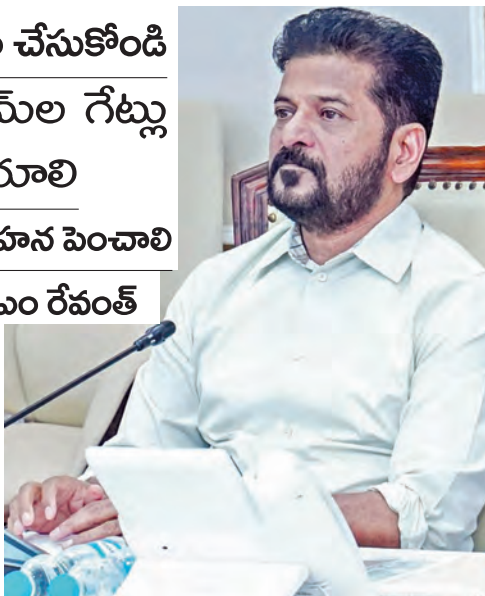
అదేశించారు. ఈ వర్షాకాలంలో ఎక్కడైనా డ్యామీల విషయంలో ఇబ్బందులు తలెత్తితే అధికారులపై కుల వర్షాలు తీసుకుంటామని ముఖ్యమంత్రి రేవంత్ రెడ్డి హెచ్చరించారు. వాతావరణ శాఖ అంచనాలు, నివేదికల ఆధారంగా పంటల సాగుపై నిర్ణయాలు తీసుకోవాలని వ్యవసాయ శాఖ అధికారులను >>7

పంటల మార్పిడిపై రైతుల్లో అవగాహన పెంచాలి వర్షాకాల సన్నద్ధత సమీక్షలో సిఎం రేవంత్ మళ్లీవాలనే దానిపై సుప్రీం ప్రధాన విధానం రూపొందించాలని సీఎం రేవంత్ నాగార్జున ఉన్నప్పుడు నిర్మించిన సీలేరు, తుంగభద్ర డ్యామీల నుంచి ఉత్పత్తి అవుతున్న విద్యుత్తును రావాల్సిన వాటాపై నివేదిక రూపొందించాలని విద్యుత్ శాఖ అధికారులను సీఎం రేవంత్ నాగార్జున రాష్ట్రంలోని అన్ని డ్యామీల గేట్ల మరమ్మత్తులు యుద్ధప్రాతిపదికన చేపట్టాలని సీఎం రేవంత్ నాగార్జున డ్యామీల మెయింటెనెన్స్ పై ముఖ్యమంత్రి ఎ.రేవంత్ రెడ్డి అధికారులను ఆరా తీశారు. గతంలో కడం ప్రాజెక్టులో తలెత్తిన ఇబ్బందులను సీఎం గుర్తు చేశారు. గేట్ల మరమ్మత్తులు, మెయింటెనెన్స్ లకు సంబంధించి ఇప్పటికే రూ.300 కోట్లు విడుదల చేశామని ఆర్థిక శాఖ అధికారులు ముఖ్యమంత్రికి తెలియజేశారు. ఎన్ని నిధులు అవసరమైనా వెంటనే విడుదల చేయాలని సీఎం >>7