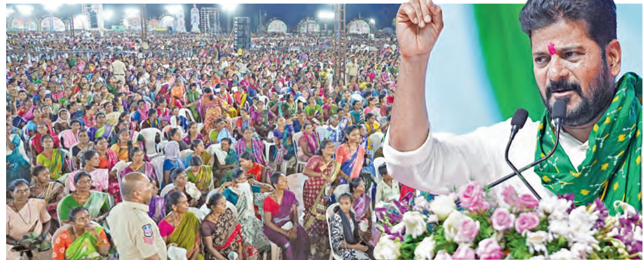
సోమవారం కాంగ్రెస్ నగర్ ఎక్స్ ప్రెస్ బహిరంగ సభకు హాజరైన ప్రజలు

ఇందిరమ్మ ఇళ్లు నిర్మిస్తాం కొలాం కొటాలి నుండి సామాహికంగా ఇందిరమ్మ గృహ ప్రవేశం ఆరంభం కొత్తగా రెండున్నర లక్షల ఇళ్లు మంజూరు ప్రతి గింజను కొంటాం, ఆందోళన వద్దు కాంగ్రెస్ నగర్ ఎక్స్ ప్రెస్ బహిరంగ సభలో సిఎం రేవంత్